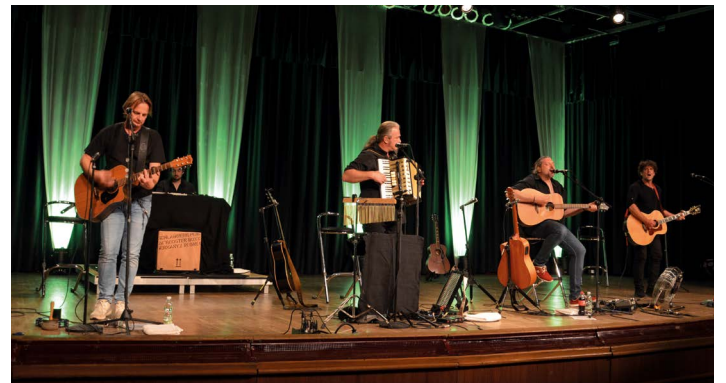
Bild rechts: Austropop vom Feinsten: SOLOzuVIERT sorgen bei ihrem Konzert für eine hervorragende Stimmung.

Der Ersatztermin wird noch bekannt gegeben. Die Austropop-Musiker SOLOzuVIERT gastierten in der Kürnberghalle und begeisterten das Publikum mit Hits wie „Huach zua“ und „Wann's loved dann lafts“.