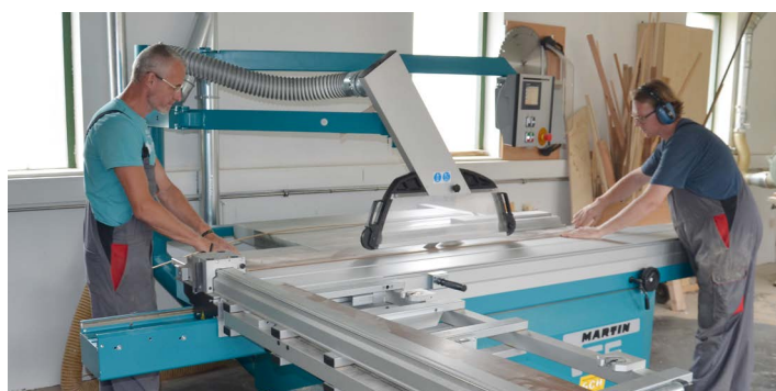
Effizientes und sicheres Arbeiten mit der neuen Kreissäge.

Die beiden Tischler des Wirtschaftshofes sind ein ganzes