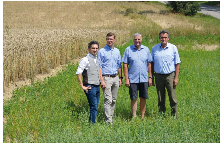
Absetzmulden sind eine gute Lösung, um Straßen, Siedlungen oder Kanäle bei Starkregen besser zu schützen.

Auf den Feldern werden Blühwiesen für Bienen, Insekten und Niederwild, wie zum Beispiel Hasen und Fasane, angesät.