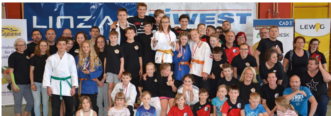
ASKÖ Judo Leonding bei der Schüler-Landesmeisterschaft in der Sporthalle.