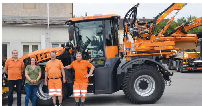
Der neue Fastrac ist vielseitig einsetzbar.