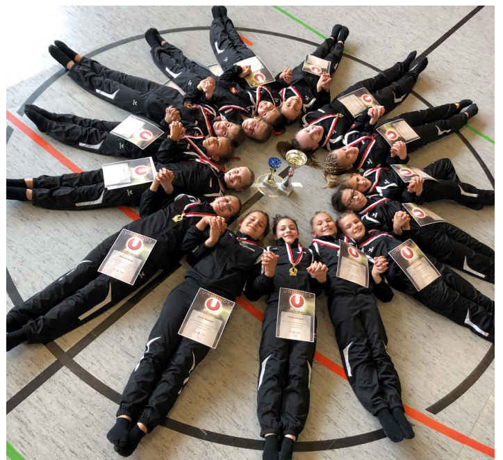
Die erfolgreichen Kunstturnerinnen und Kunstturner.

die Leistungen der weiteren 19 Teilnehmenden des DALZ konnten sich sehen lassen. Sie erlangten vier zweite Plätze, zwei dritte und vierte Plätze sowie jeweils einen fünften, sechsten, siebten und zwei achte Plätze. Wir gratulieren herzlich und wünschen weiterhin viel Erfolg!