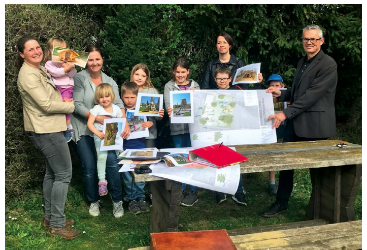
Bild rechts: Bei der Spielplatzgestaltung haben die Leondinger Kinder ein Wörtchen mitzureden.

Den Kindern wird somit die Möglichkeit geboten mitzureden, mitzugestalten und mitzubestimmen.