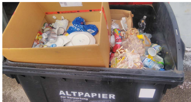
Bild rechts: SO NICHT! Die Sammelinseln müssen sauber gehalten und die Behälter ordnungsgemäß verwendet werden!

In Leonding gibt es ca. 20 öffentliche Altstoffsammelinseln. Die Behälter für Altpapier, Altglas und Kleidung dürfen nur für die vorgesehenen Altstoffe verwendet werden. Alle anderen Müllablagerungen sind strengstens verboten und werden ausnahmslos zur Anzeige gebracht.