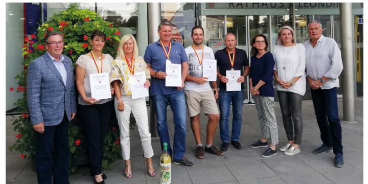
Golfbegeisterte Spielerinnen und Spieler sowie Vertreterinnen und Vertreter der Stadt Leonding.