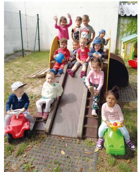
Bild rechts: Die Krabbelstube Hart wird in neue Räumlichkeiten übersiedeln.

hochwertige Räumlichkeiten in Holzriegelbauweise mit einer schönen Außenanlage. Dabei handelt es sich um eine mobile Holzkonstruktion, die am Gelände des Schulsportplatzes in Hart errichtet wird. Die Übersiedelung soll kommenden Winter stattfinden. Der endgültige zukünftige Standort der Krabbelstube Hart wird im Zuge der Umbaumaßnahmen im Schulzentrum Hart festgelegt.