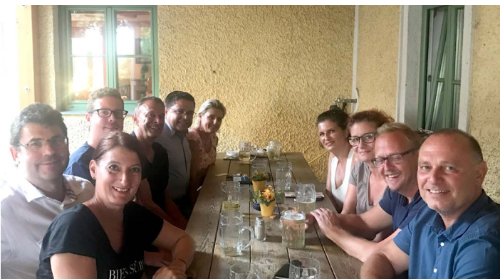
Letzter Galileotreff vor der Sommerpause beim Mostbauern.